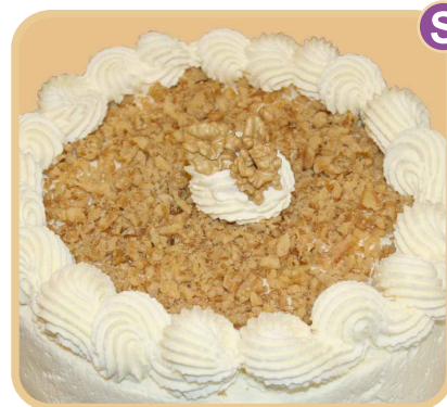
Nuez o almendra

Bizcocho de amapola con remojado de naranja, relleno con manjar y crema chantillí.