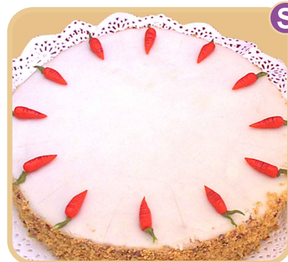
Suiza de zanahoria

Fino bizcocho de chocolate con remojado de frambuesa, relleno con crema de chocolate, mermelada de frambuesa y chocolate en rama.